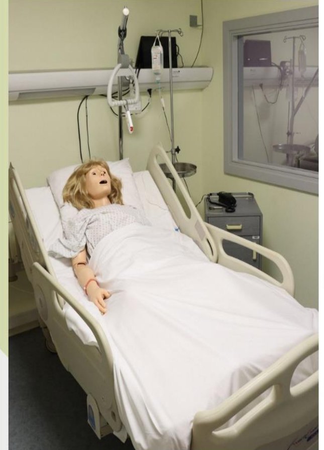
Laboratoire de simulation